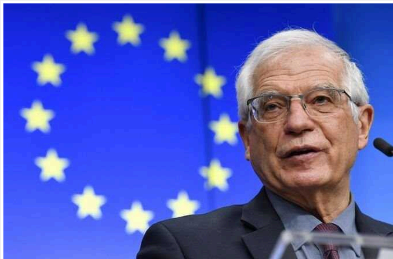
Боррель анонсував затвердження Фонду військової допомоги Україні від ЄС

Євросоюз може вже найближчими днями створити військовий Фонд допомоги Україні в рамках Європейського фонду миру. Це питання сьогодні було обговорено на неформальній зустрічі міністрів закордонних справ ЄС.