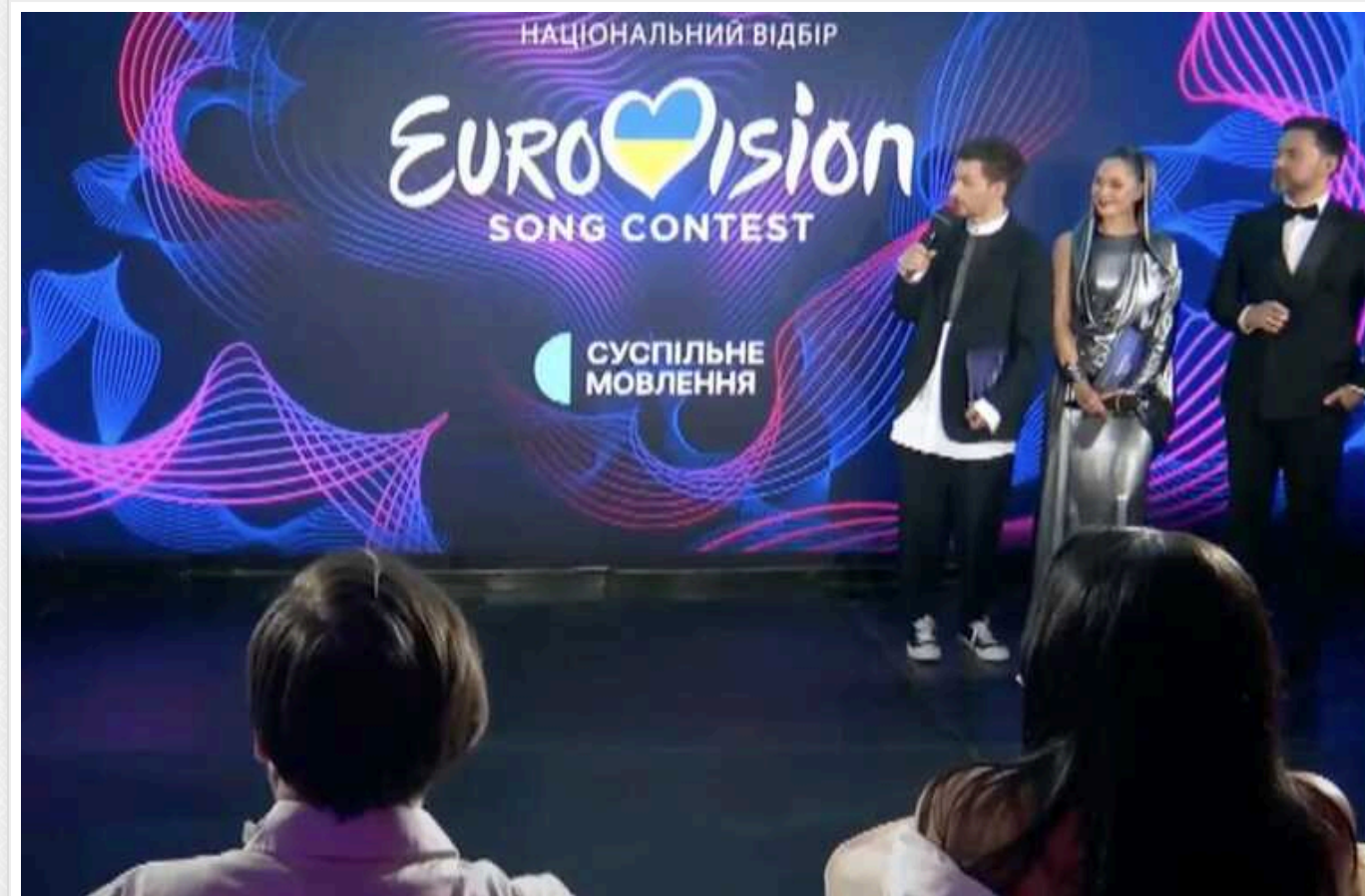
Оголошення переможця Нацвдбору на Євробачення-2024 перенесли через технічні несправності в застосунку "Дія"

З лютого переможця Нацвдбору на Євробачення 2024 не буде оголошено через технічні несправності в застосунку "Дія". Голосування продовжиться, як тільки запрацює сервіс, і триватиме протягом усього наступного дня, 4 лютого.