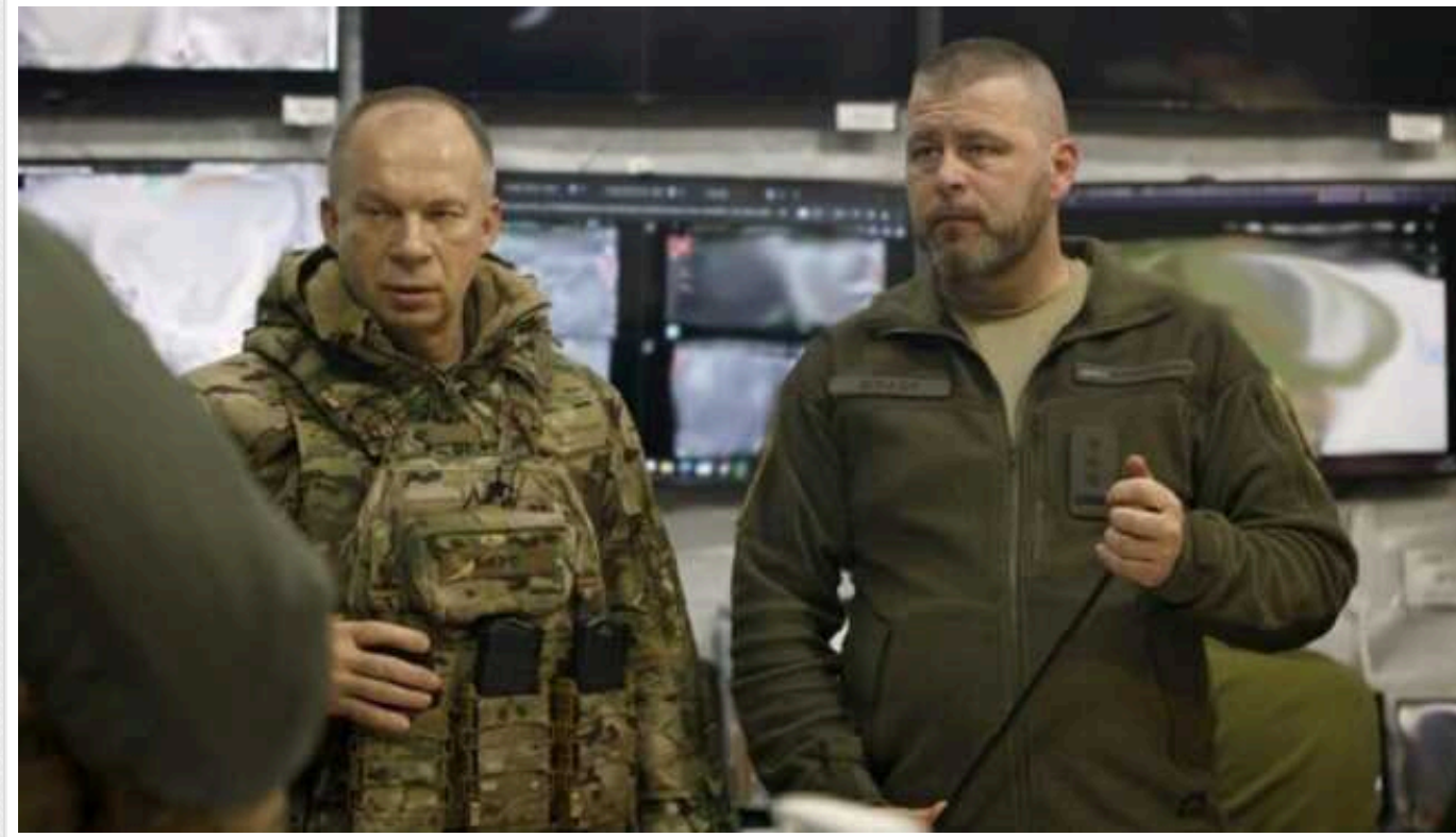
Сирський провів перерозподіл сил і засобів на Куп'янському напрямку

Командувач Сухопутних військ Збройних сил України Олександр Сирський здійснив чергову робочу поїздку на передову, де зустрівся з військовими, які тримають оборону на Куп'янському напрямку. Там у нього відбулися оперативні наради із командуванням.