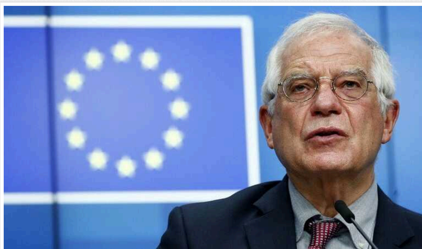
Боррель назвав Близький Схід "котлом", який може вибухнути

Голова дипломатії Євросоюзу Жозеп Боррель вважає, що Близький Схід перетворився на котел, який може вибухнути. На його думку, війна Ізраїлю з ХАМАСом запустила "ефект доміно".