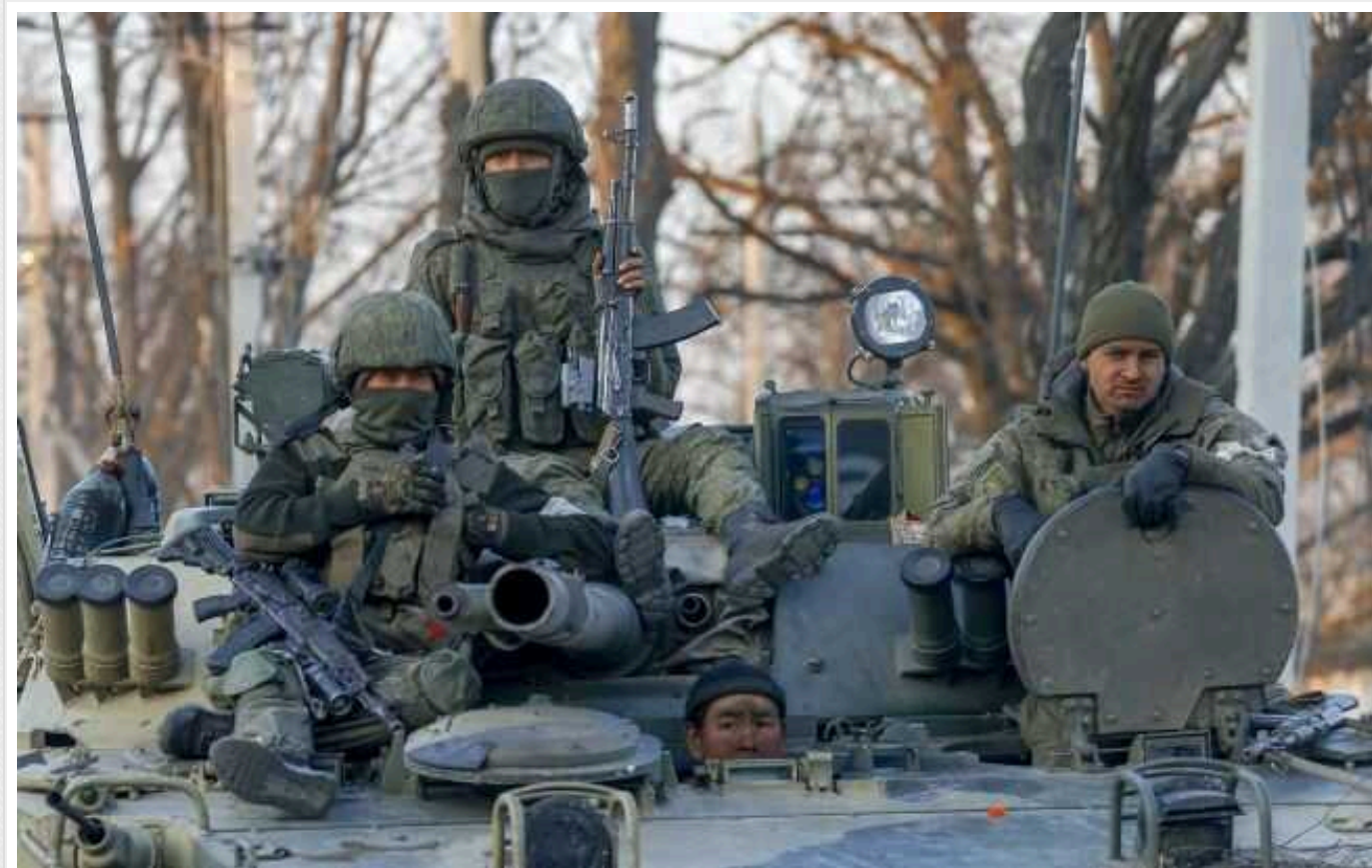
РФ почала виробляти дрони на заводі в окупованому Бердянську, - АТЕШ

Партизани змогли з'ясувати, що Росія організувала виробництво безпілотників на "Бердянському Заводі Жаток".