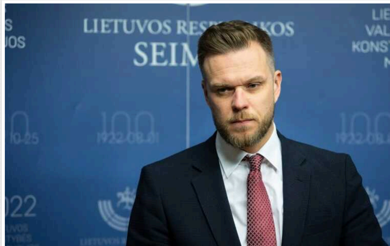
Глава МЗС Литви: ЄС не може допустити військових здобутків для Путіна

Міністр закордонних справ Габріелюс Ландсбергіс заявив, що Європейський союз не може допустити військових здобутків для кремлівського диктатора Володимира Путіна. У зв'язку з цим ЄС має надавати Україні подальшу військову допомогу для боротьби з агресором.