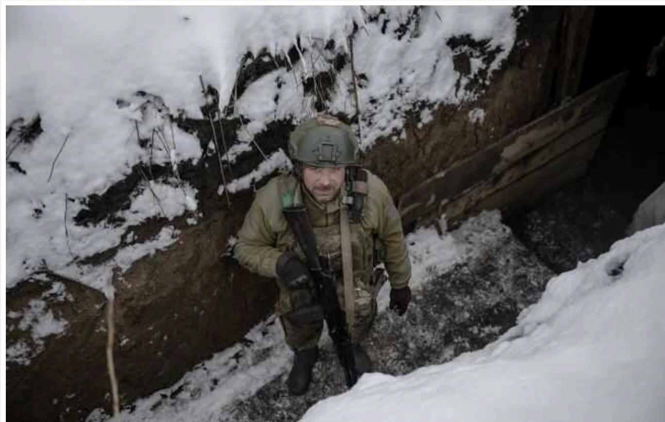
Ситуація на фронті: протягом доби сталося 45 бойових зіткнень

Протягом дня авіація Сил оборони завдала ударів по 12 районах зосередження особового складу противника. Однак, незважаючи на значні втрати, РФ не цурається планів повної окупації України.