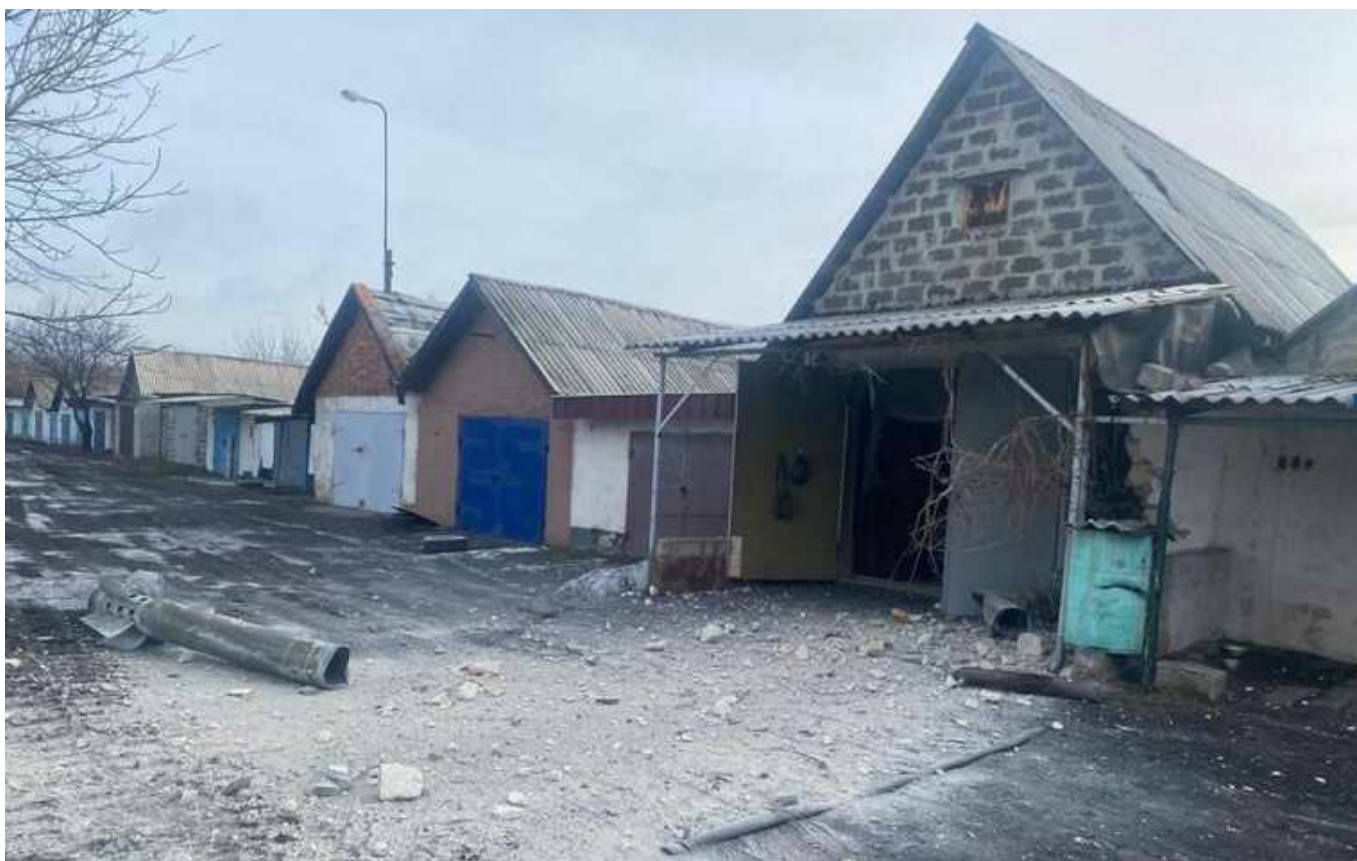
Сьогодні вранці окупанти обстріляли Донеччину зі "Смерчів"

За повідомленням місцевої влади Донецької області, сьогодні вранці росіяни зі