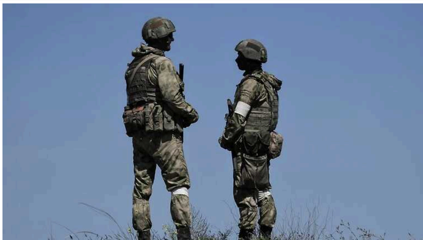
ЗС РФ суттєво просунулися в районі Авдіївки, - DeepState