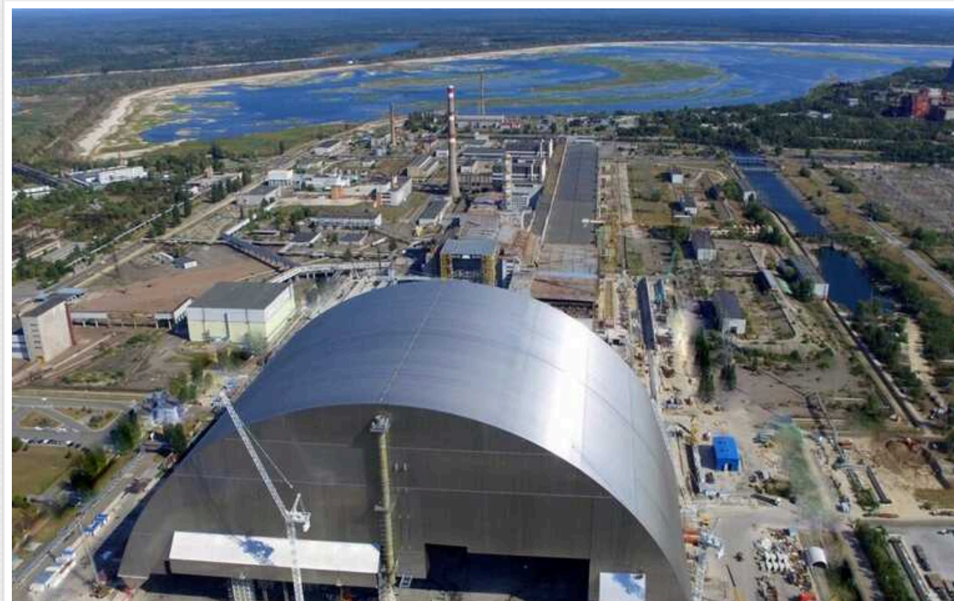
У Чорнобилі за 6,8 мільйон гривень проведуть монолітні роботи в сховищі радіоактивних відходів

Державне спеціалізоване підприємство "Центральне підприємство з поводженням з радіоактивними відходами" планує провести монолітні роботи у відсіках Спеціально обладнаного приповерхневого сховища твердих радіоактивних відходів (СОПСТРВ) на території КВ "Вектор", розташованому у Чорнобильській зоні. Наразі триває подання тендерних пропозицій, очікувана вартість договору складає 6 млн 800 тис. гривень.