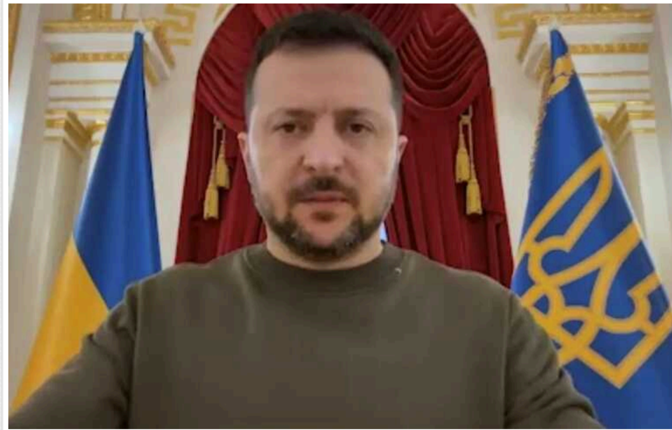
Зеленський закликав вільний світ зберігати максимальну консолідацію: "Мішенню є не тільки наша держава"

Президент Володимир Зеленський звернувся до вільного світу із закликом зберігати максимальну консолідацію й робити все для завдання поразки Росії. За словами глави держави, мішенню країни-агресорки є не тільки Україна та її незалежність.