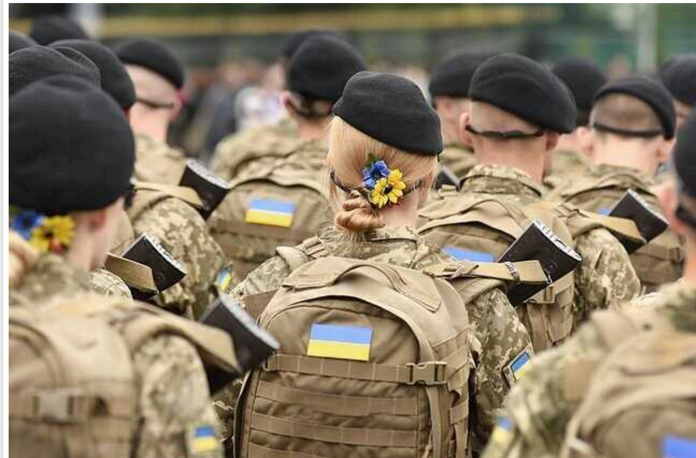
Spravdi спростувала черговий фейк: жінок лякають мобілізацією в Україні

SPRAVDI спростувала фейк з приводу того, що у Києві почали мобілізувати перших жінок.