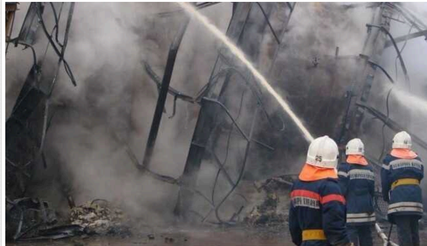
Після атаки дрона на завод "Лукойл" НПЗ у Волгограді зупинять на невизначений термін

Нафтопереробний завод спалахнув після атаки українського безпілотної. Пожежу загасили, але заяв від компанії "Лукойл" досі не надходило.