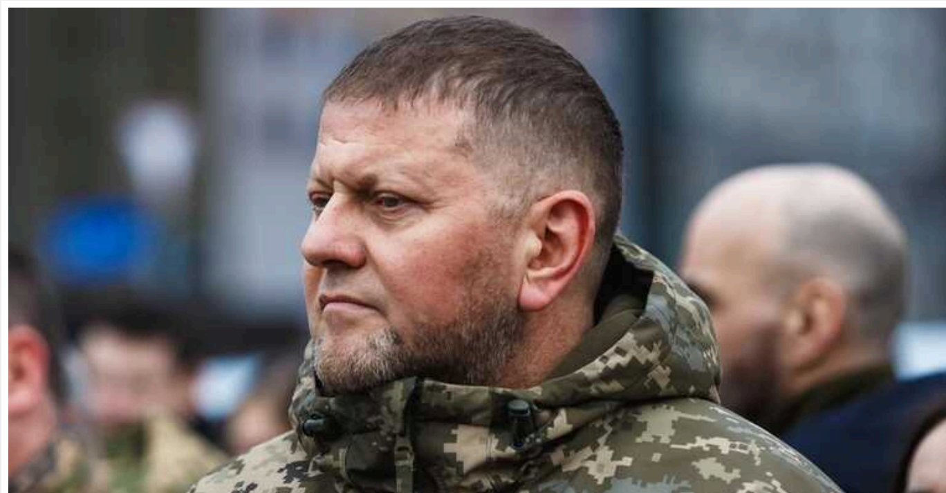
WP: Залужному ще не обрали заміну

Заміну Головнокомандувачу ЗСУ Валерію Залужному у зв'язку з його імовірним звільненням досі не обрали. Ціла країна, що перебуває у стані війни, залишається у невідомості щодо причин усунення воєначальника та кандидатів, які могли б очолити армію на тлі посилення ворожих військ.