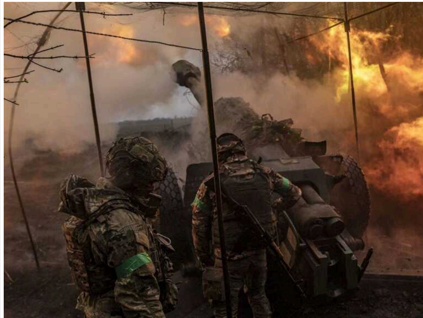
Нестача боєприпасів може змусити українські війська ухвалювати складні рішення, – ISW

Україна потерпає від нестачі боєприпасів, що перешкоджає їй вести ефективну контрбатареїну боротьбу. Це грає на руку російським окупаційним військам, які нині почали встановлювати стаціонарні вогневі позиції на тривалий період часу, не боючись їхнього знищення.