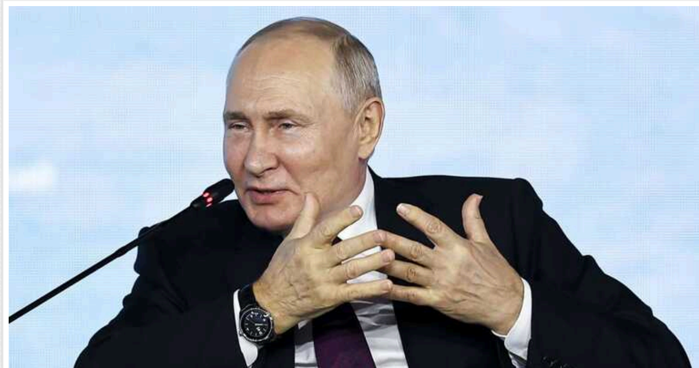
Путін заявив, що це "вся Росія" хотіла захопити Крим і Донбас: "Я б нічого не робив"

Російський диктатор стверджує, що без відповідного "настрою" росіян, ніякої кривавої війни з Україною не було б.