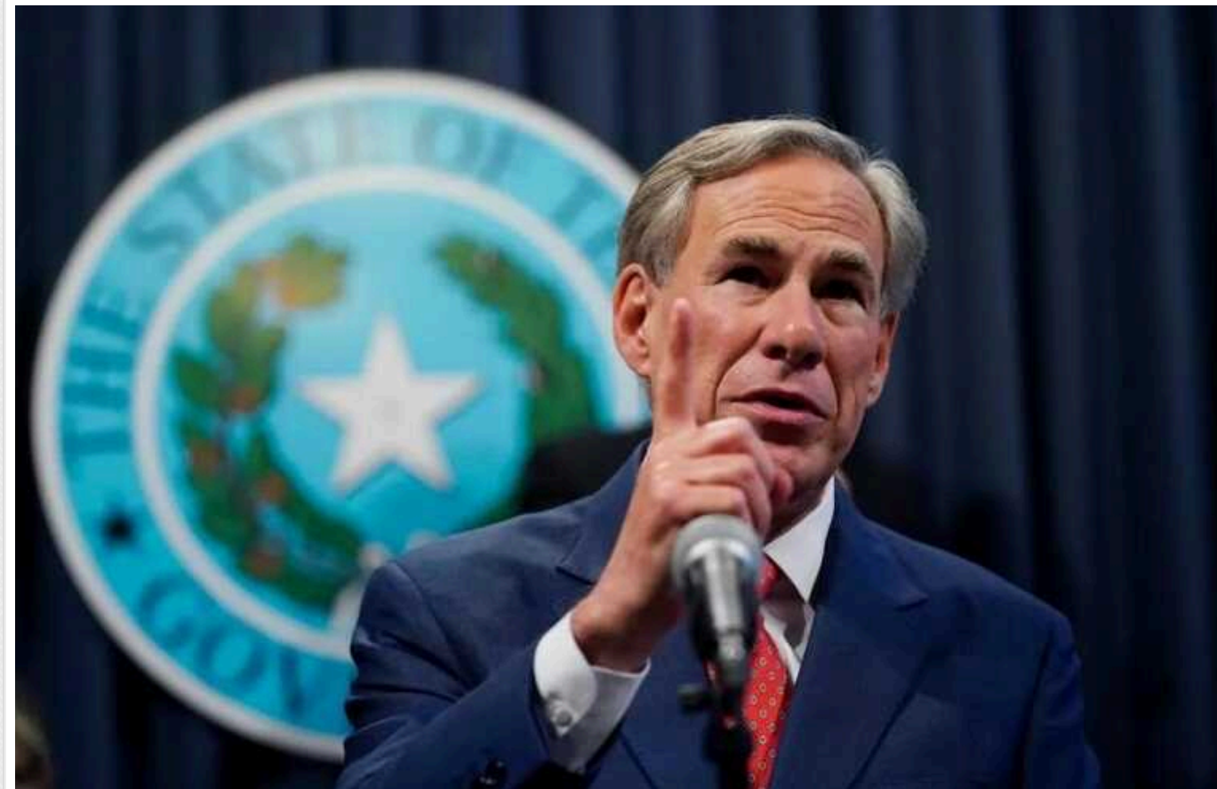
У Мережі опублікували «дипфейк» за участю губернатора Техасу, у якому Грег Ебботт ставить Байдену за приклад Путіна

У Мережі розповсюджують відео, в якому губернатор Техасу Грег Ебботт, у якого виникли суперечки з федеральною владою США навколо кордону, нібито ставить Байдену за приклад Путіна.