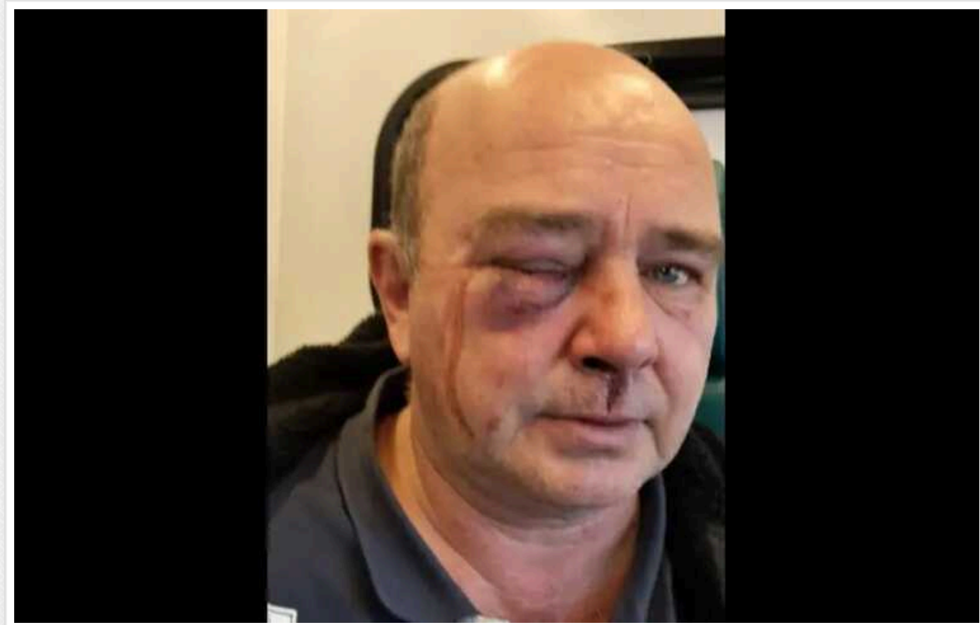
У Київській області працівники ТЦК жорстоко побили чоловіка на очах у поліції

В Київській області працівники ТЦК змусили чоловіка вийти з машини, після чого почали його бити.