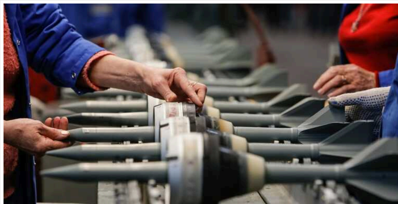
ЦНС: Представники російського ВПК скаржаться на збитки через війну з Україною

Поки президент РФ Володимир Путін розповідає про небувайлий розквіт російського військово-промислового комплексу, підприємства російської "оборонки" зазнають збитків. Їх змушують виконувати держзамовлення за цінами 2019 року, втрати ж на виробництво вони несуть за ринковими цінами, що в умовах санкцій та інфляції дуже сильно поповзли вгору.