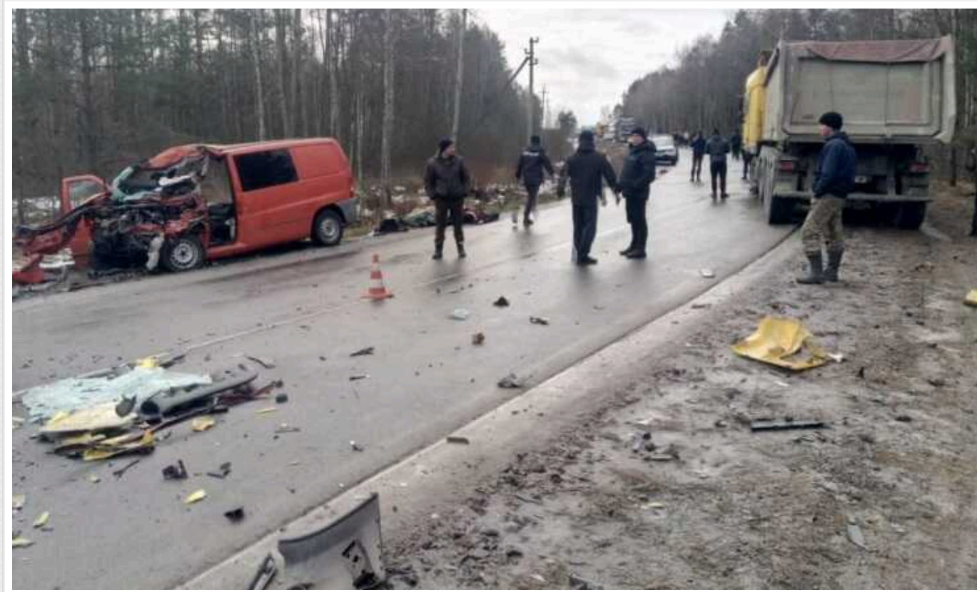
На Рівненщині сталася смертельна ДТП: без батьків та матерів залишилися діти з двох сімей

На Рівненщині сталася смертельна ДТП за участю мікроавтобуса та вантажівки, в якій загинули четверо людей. Сиротами залишилися 13 дітей.