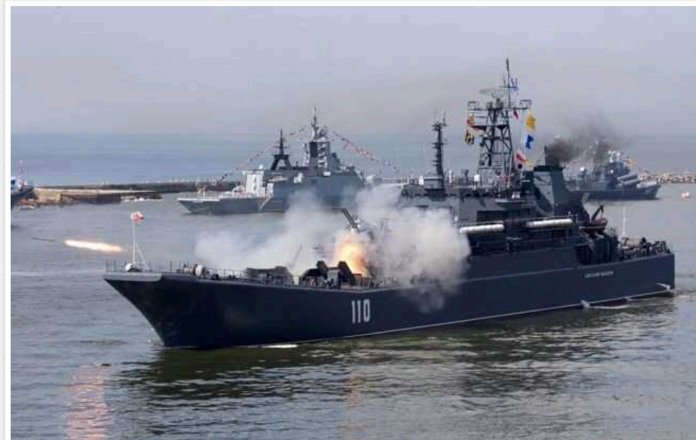
П'яту частину Чорноморського флоту РФ вивели з ладу, - німецький експерт