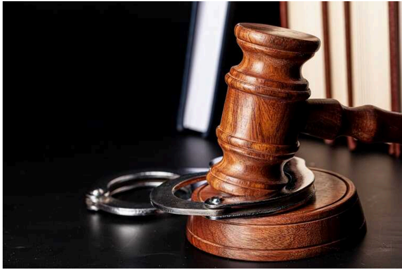
На Київщині викрили посадовицю: "заробила" на причепах для ЗСУ

У Броварському районі Київської області посадовицю однієї з міськрад підозрюють у закупівлі причепів для потреб військової частини по завищених цінах. Загалом було нанесено збитків на майже пів мільйона гривень.