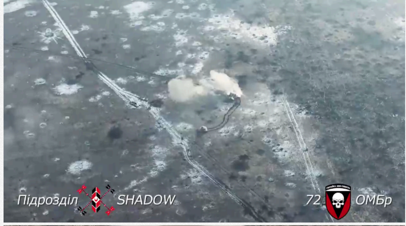
На позиції українських військ загарбники посунули колоною з 11 одиниць техніки. Окупанти завбачливо вишикувалися вервечкою і навіть знерухомили власний танк перед початком наступу, тож захисникам було зручніше вибивати ворожі танки, МТЛБ та БМП.