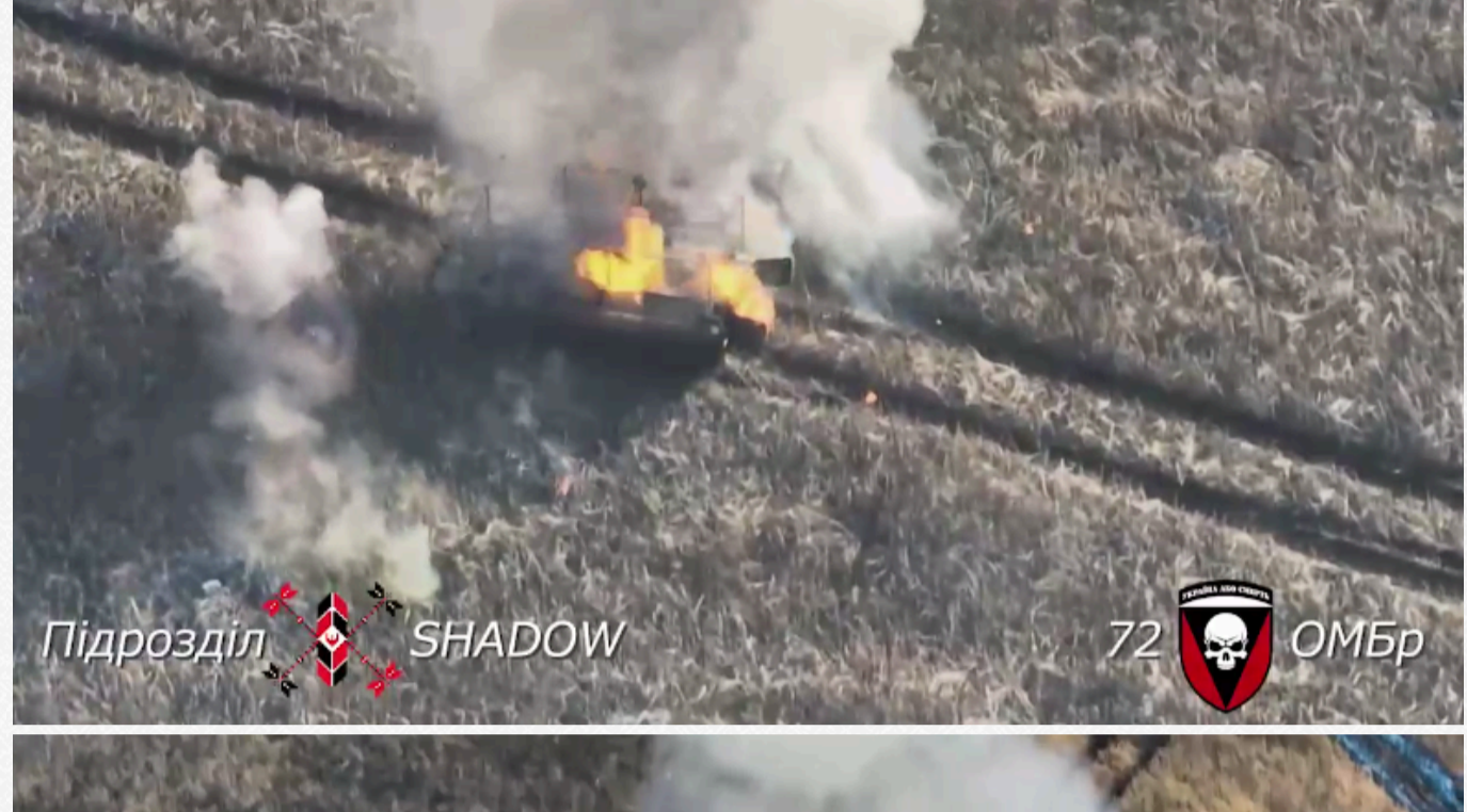
Увесь процес "демилітаризації" росіян зафіксували дрони підрозділу аеророзвідки Shadow.