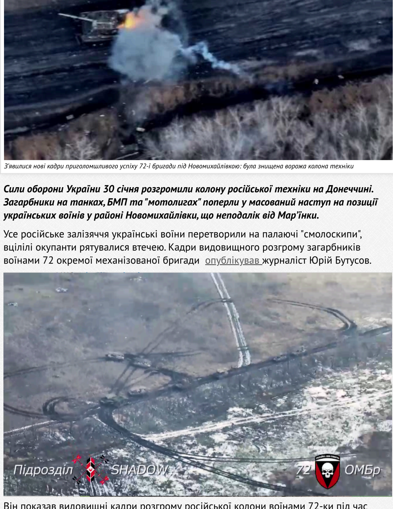
Він показав видовищні кадри розгрому російської колони військами 72-ї бригади під час ворожого штурму у районі Новомихайлівки 30 січня.

Усе російське залізничне українські війни перетворили на палаючі "смолоски", вцілілі окупанти рятувалися втечею. Кадри видовищного розгрому загарбників військами 72 окремої механізованої бригади опублікував журналіст Юрій Бугусов.