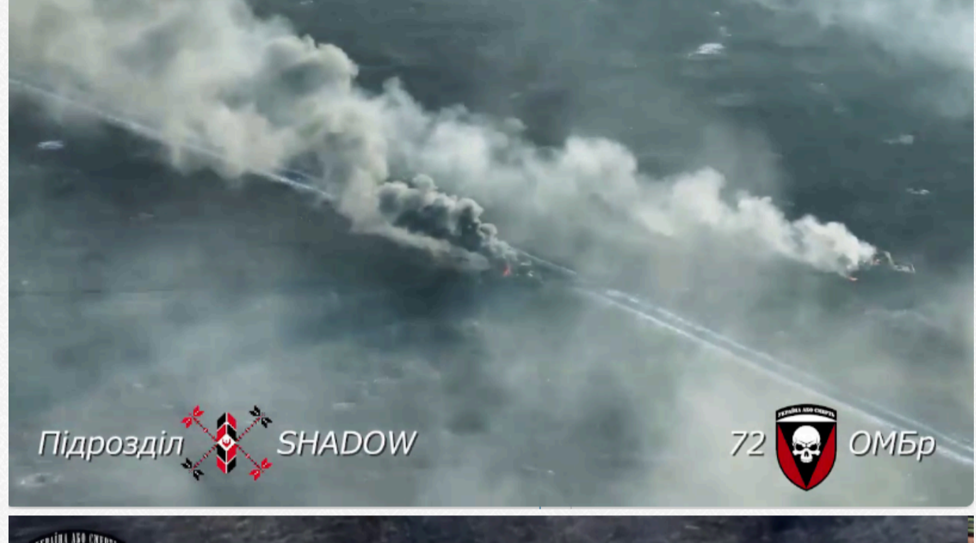
Як повідомляють у РУБЛАК "Булава" 72 ОМБр, ворожу колону на підступах до позицій Сил оборони українські війни помітили близько 12:50. Вже до 15:20 усі 11 одиниць ворожої техніки, а саме 3 танки, 7 МТЛБ та 1 БМП було знищено.