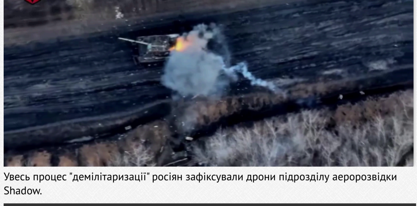
У "поволанні" взяли участь бійці "Булави" (знищили 3 танки, 5 МТЛБ, 1 БМП), 2 МБ 72 ОМБр (ліквідували 2 МТЛБ) та ПТРК бригади (1 знищений МТЛБ).