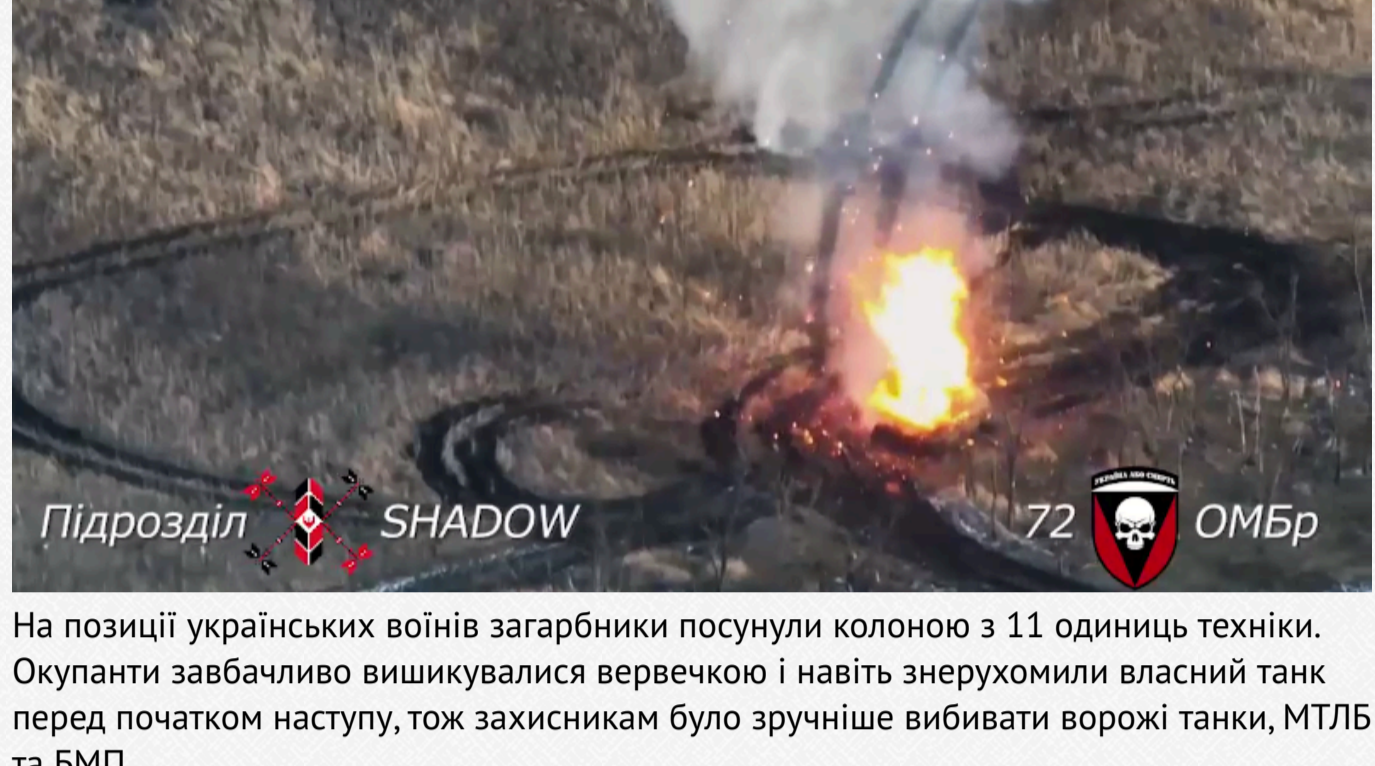
"Відео очима пілота підрозділу аеророзвідки Shadow, що здійснював контроль руху ворожої техніки та фіксував вогневе ураження дронів-камікадзе та ПТРК 72-ї окремої механізованої бригади ім. Чорних Запорозжців", – зазначив Бугусов.