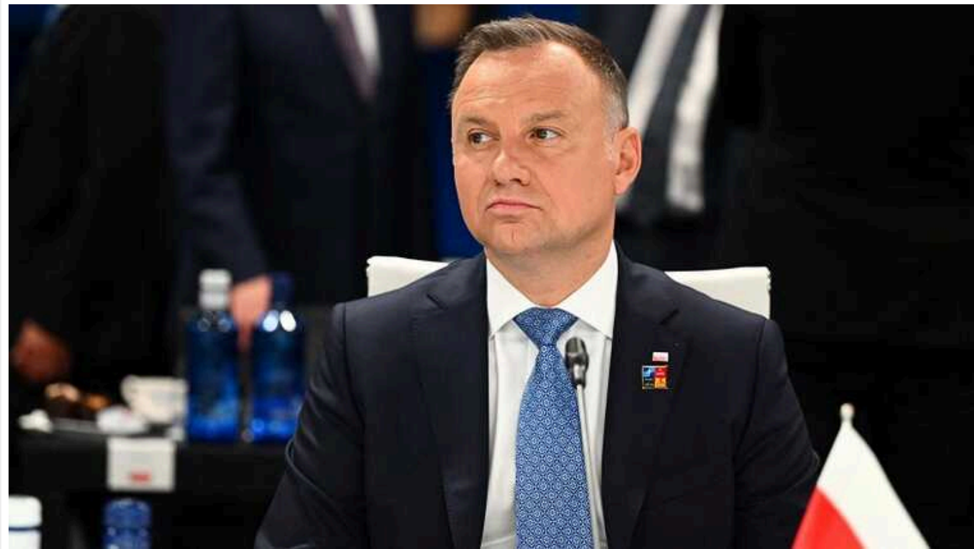
Анджей Дуда засумнівався у деокупації Криму: посол України нагадав йому, що це спільне завдання

Президент Польщі Анджей Дуда засумнівався, що Україна зможе деокупувати Крим. У посольстві вже відреагували, нагадавши, що це "наше спільне завдання та зобов'язання перед вільним світом".