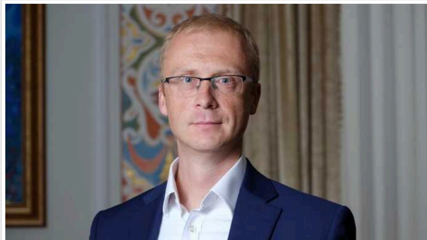
Нікарагуа отримало ноту протесту від МЗС України через візит делегації РФ з окупованого Криму

МЗС України передало офіційну ноту протесту Нікарагуа. Причиною для неї став візит російської делегації до цієї країни з тимчасово окупованого Криму.