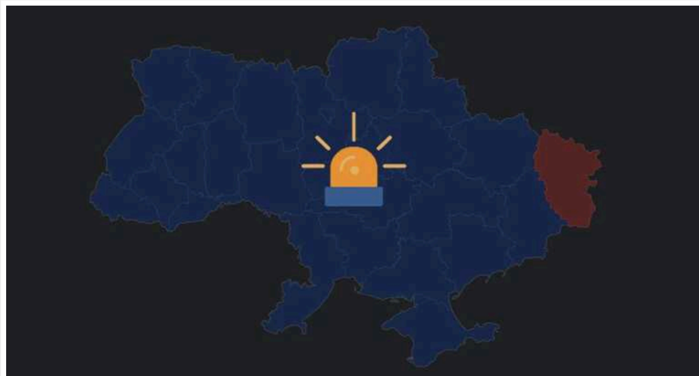
По всій Україні тривога: злетів російський МіГ-31К

Масштабну повітряну тривогу було оголошено в Україні сьогодні, 3 лютого. Зафіксовано зліт винищувача МіГ-31К.