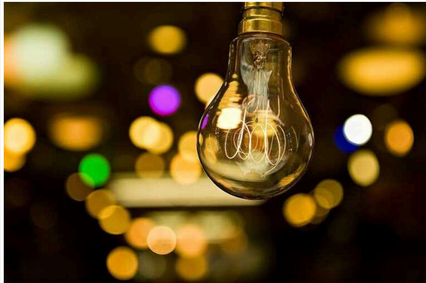
В Україні виник надлишок електроенергії: струм відправили до Польщі

В Україні ситуація в енергосистемі станом на 3 лютого є стабільною. Виник профіцит електроенергії, надлишки передавалися до енергосистеми Польщі; на поточну добу планується експорт електроенергії до Молдови.