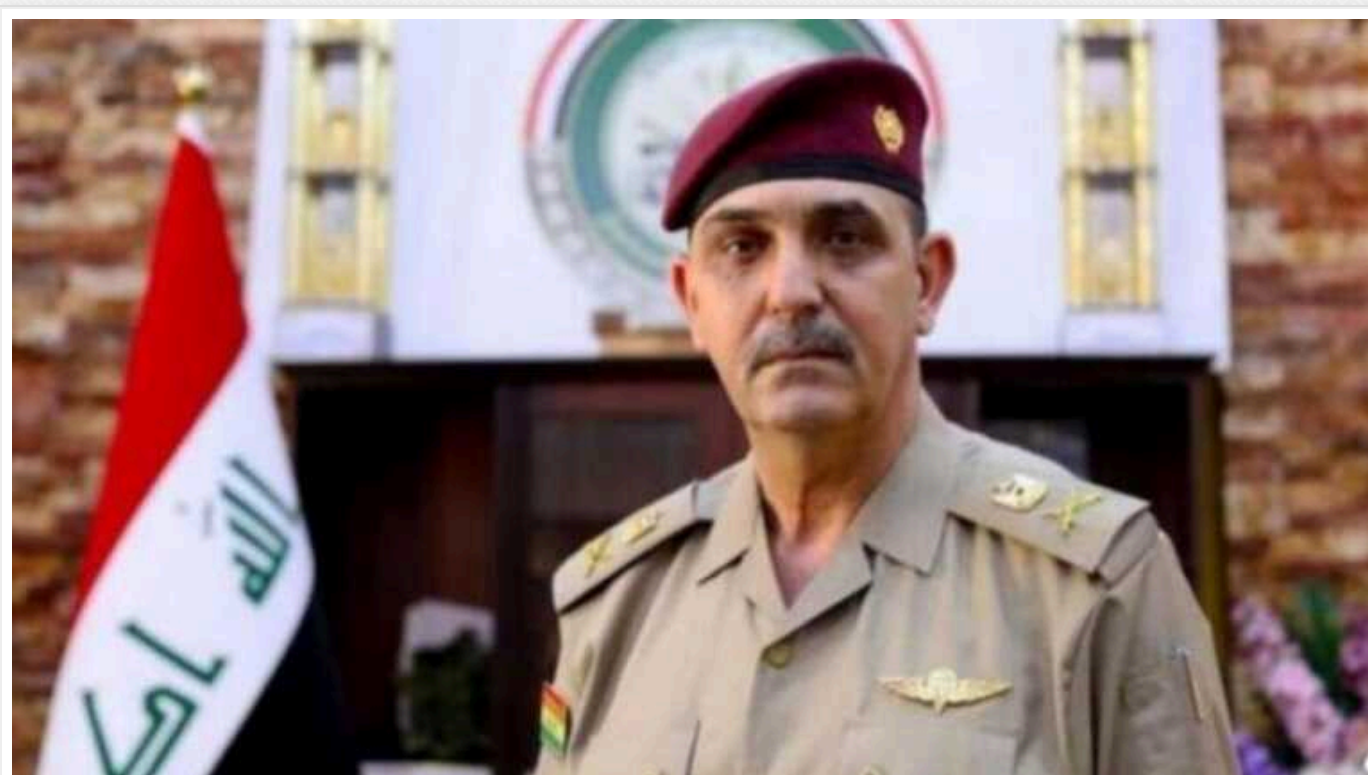
Ірак назвав удари США "порушенням суверенітету країни"