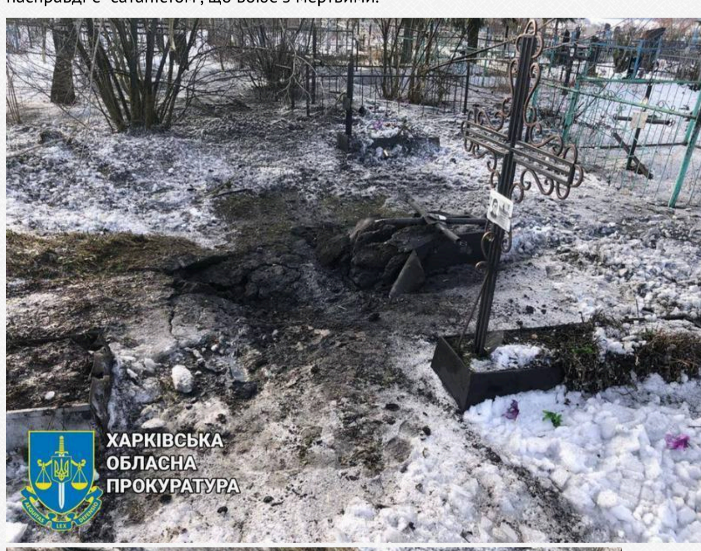
ХАРКІВСЬКА ОБЛАСНА ПРОКУРАТУРА