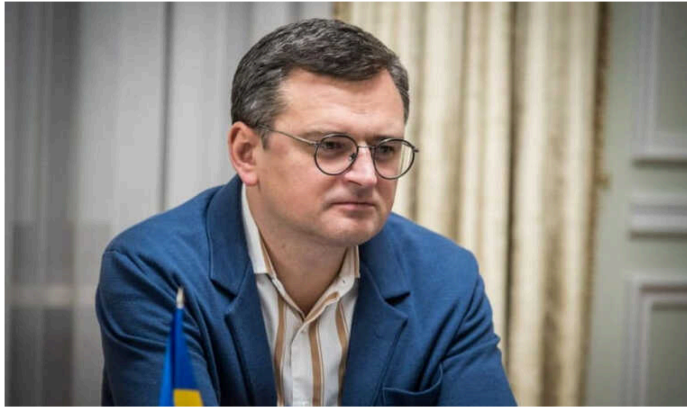
Кулеба: Путін чекав на перші вибори Трампа, тепер він чекає на другі. Україна не має особливих побоювань

Україна не має особливих побоювань щодо результатів президентських виборів у США в листопаді.