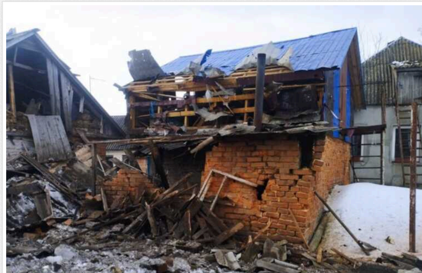
Удар окупантів по цивільній інфраструктурі Сумщини: пошкоджено дитсадок та будівлю підприємства

За минулу добу зафіксовано 34 обстріли 25 населених пунктів Сумської області з території РФ. Загалом нараховано 125 ударів.