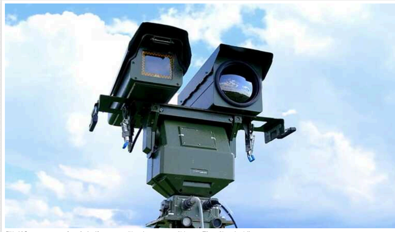
Бійці "Сталевого кордону" ліквідували російські комплекси "Муром-П" та "Іронію-М"

Прикордонники бригади Гвардії наступу "Сталевий Кордон" знищили "очі" російських окупантів на Харківському напрямку. Йдеться про новітній ворожий оптико-електронний комплекс "Іронія-М" та комплекс дальнього візуального спостереження "Муром-П".