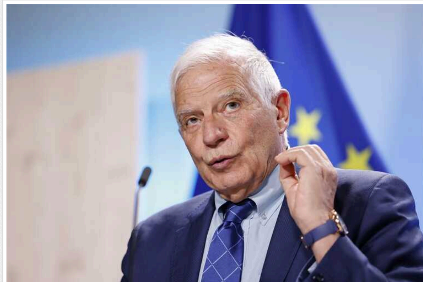
Боррель: МЗС країн ЄС обговорять імплементацію військової допомоги для України

Неформальна Рада міністрів ЄС із закордонних справ, яка відбувається сьогодні у Брюсселі, серед інших питань продовжить обговорення ситуації в Україні та, зокрема, питання імплементації зобов'язань щодо посилення військової допомоги для України. Про це сьогодні у Брюсселі перед початком зустрічі заявив Високий представник ЄС Жозеп Боррель, повідомляє кореспондент "Укрінформу".