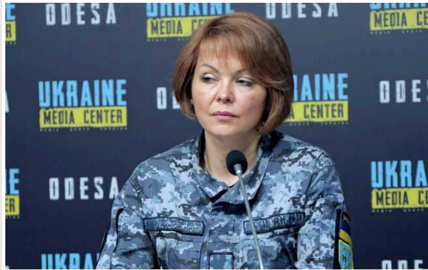
У ЗСУ відповіли на заяві ISW про те, що нестача боєприпасів обмежує Україну на фронті

Аналітики ISW вважають, що нестача артилерійських снарядів може обмежувати українські війська на фронті. У ЗСУ кажуть, що йдеться не про брак снарядів, а про переважальну кількість цілей.