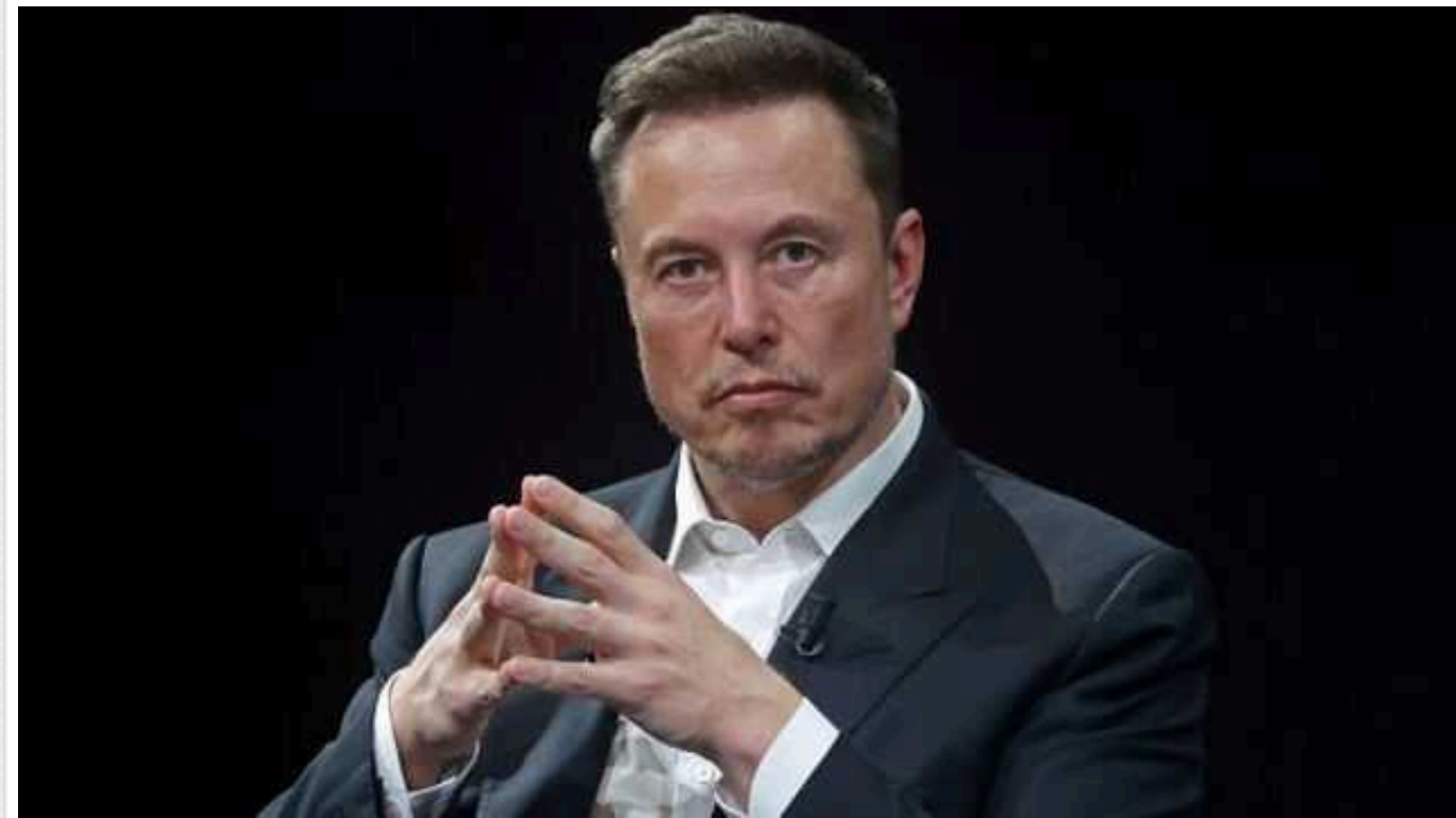
Маск звинуватив Байдена у спробі побудувати за допомогою мігрантів "однопартійну державу"

"Стратегія Байдена дуже проста: 1. Отримати в країні якнайбільше нелегалів. 2. Легалізувати їх, щоб створити постійну більшість – однопартійну державу. Ось чому вони заохочують так багато нелегальної імміграції. Простий, але ефективний спосіб", – написав Маск у X.