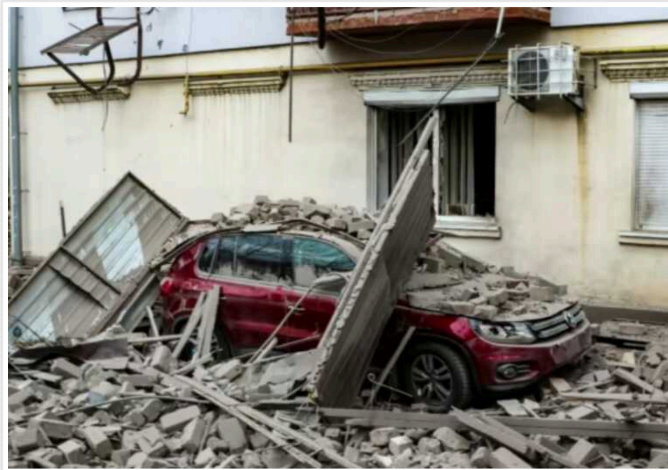
Обстріл Херсонщини: через атаку окупантів поранено семеро людей

За минулу добу противник здійснив 67 обстрілів Херсонської області, 7 людей дістали поранення, з них – 1 дитина.