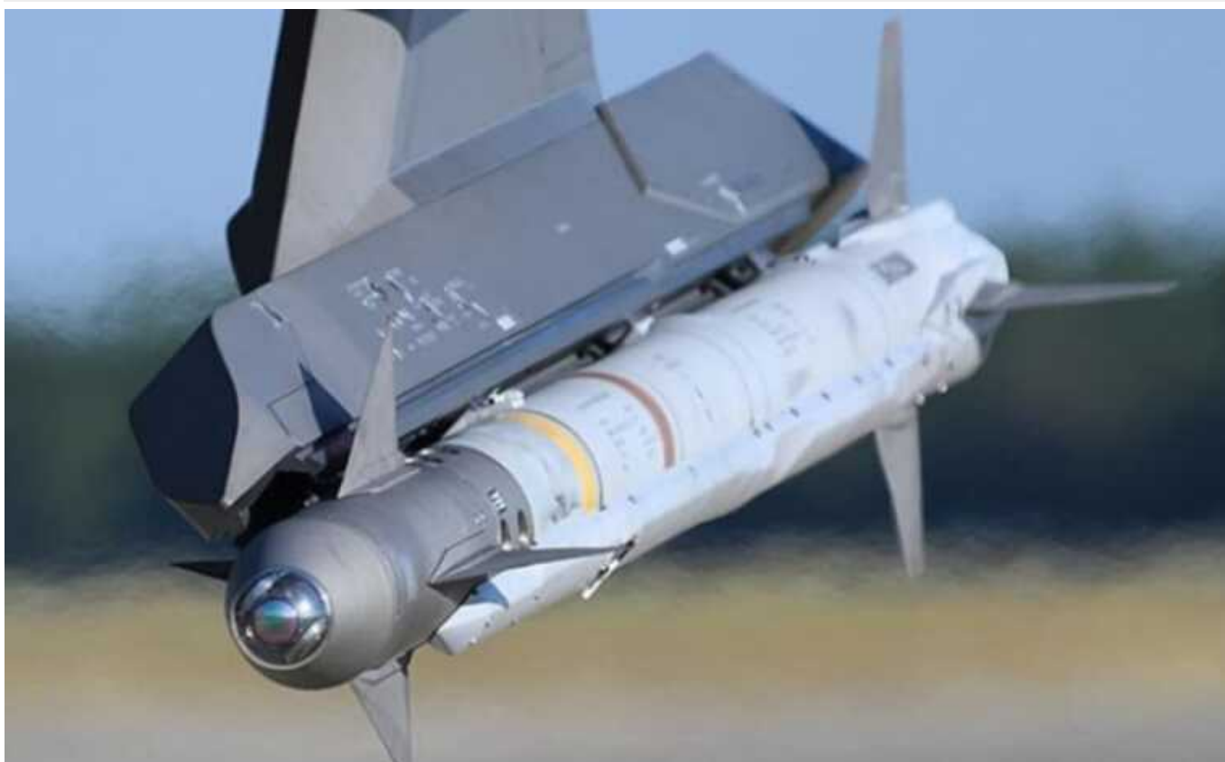
Канада замість утилізації авіаційних ракет може надати їх Україні