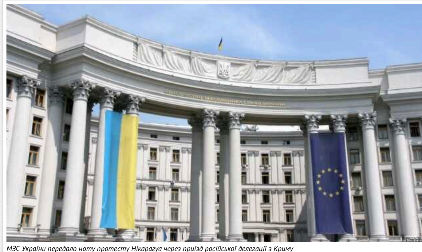
МЗС України передало ноту протесту Нікарагуа через приїзд російської делегації з Криму

МЗС України передало офіційну ноту протесту уряду Нікарагуа через приїзд російської делегації з тимчасово окупованого Криму 23 січня для підписання угод про торговельно-економічне співробітництво та побратимство між Ялтою та Гранадю.