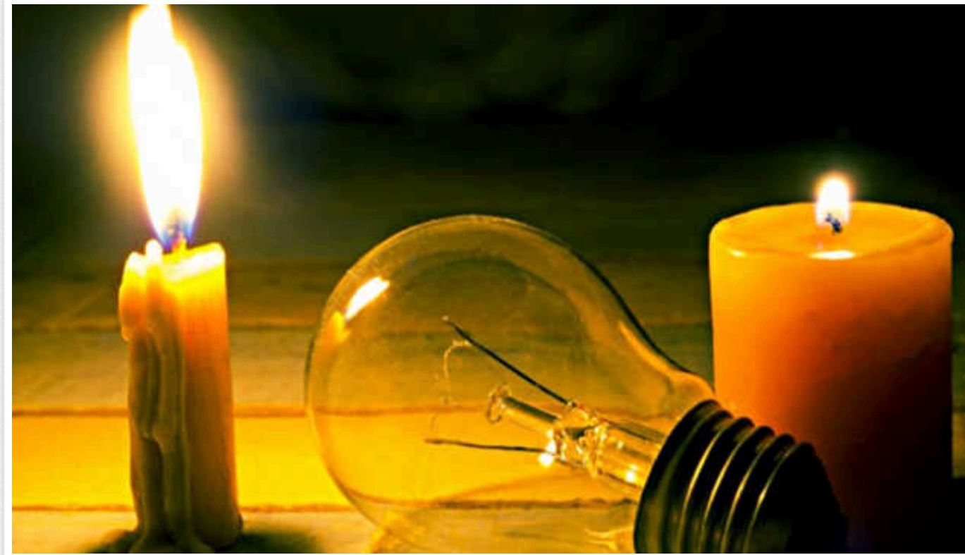
Після атаки РФ на Кривий Ріг, в місті запровадили графік аварійних відключень електроенергії

У Кривому Розі, який уночі зазнав атаки дронів, енергетики вводять графіки аварійних відключень.