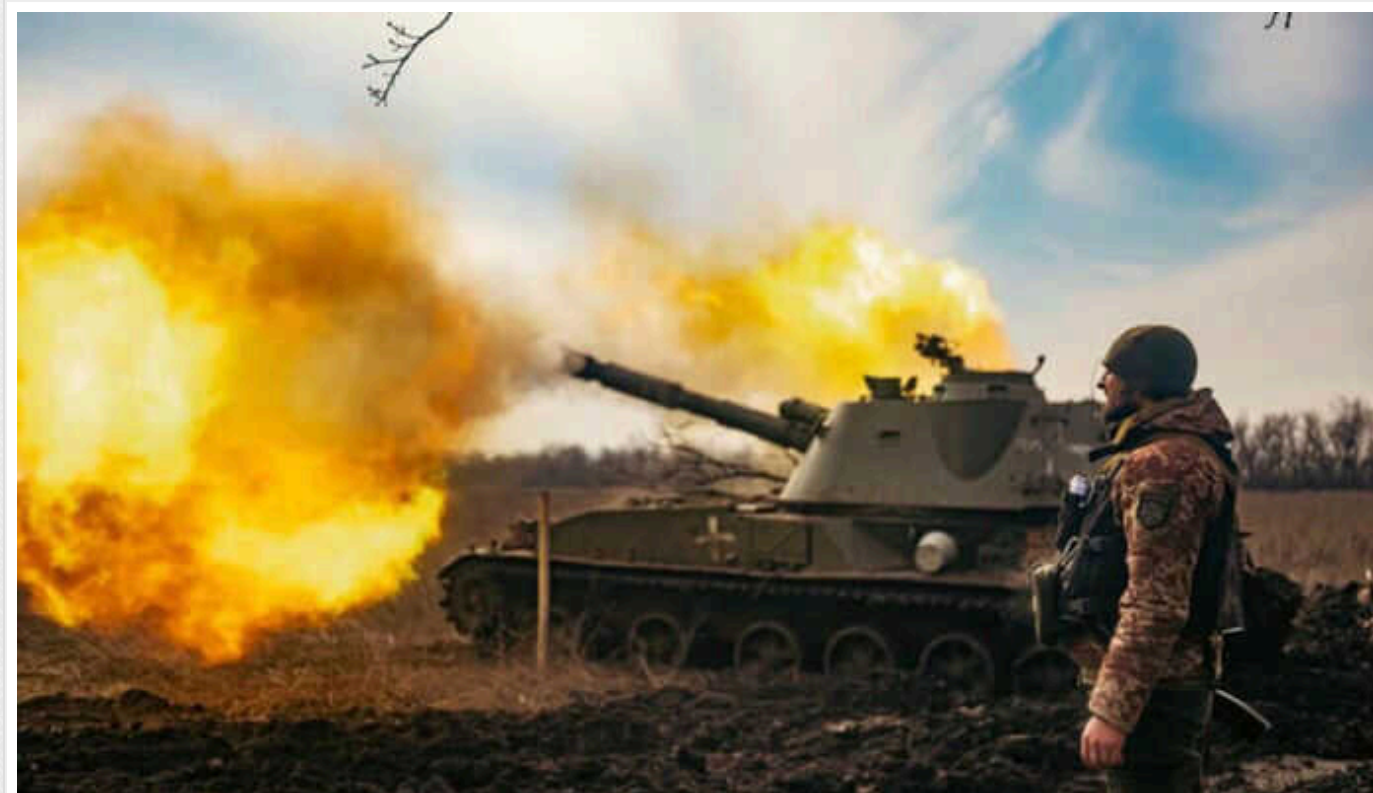
Ситуація на фронті: За добу ворог завдав 86 авіаударів, відбулося 77 бойових зіткнень

Впродовж минулої доби відбулося 77 бойових зіткнень. Загалом ворог завдав 2 ракетних та 86 авіаційних ударів, здійснив 46 обстрілів з реактивних систем залпового вогню по позиціях наших військ та населених пунктах.