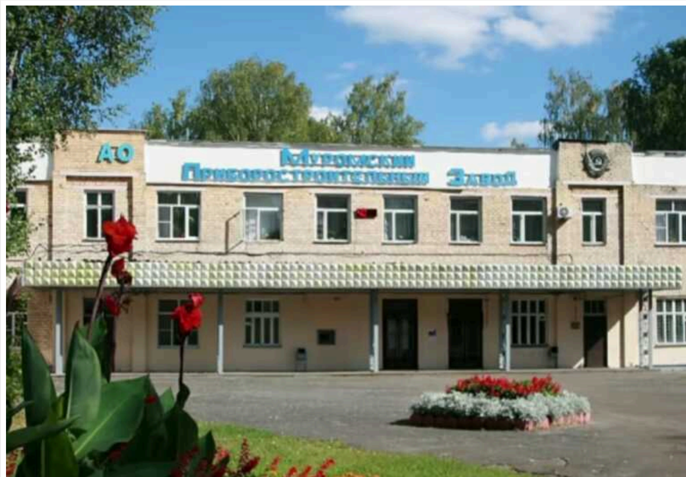
Російський ВПК страждає через війну, – ЦНС