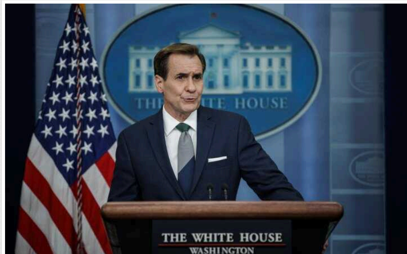
Сполучені Штати завдали ударів по семи об'єктах в Іраку та Сирії, – Кірбі

Речник Ради національної безпеки США Джон Кірбі повідомив журналістам, що військові сили США завдали ударів по семи об'єктах які використовували пов'язані з Іраном бойовики.