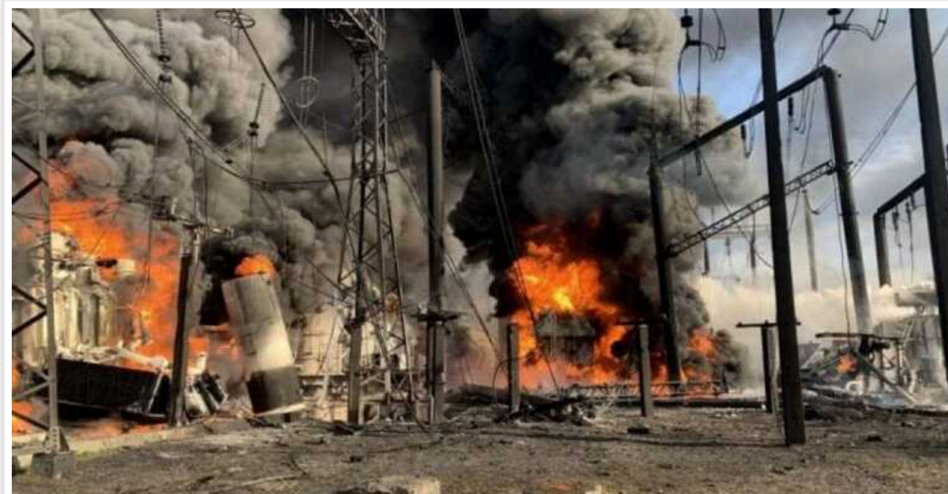
Атака ворога на енергооб'єкти: сили ППО знищили 9 з 14 "шахедів"

У ніч на 3 лютого противник атакував 14-ма ударними БПЛА типу "Шахед-136/131". Військовим вдалося знищити 9 ворожих безпілотників.