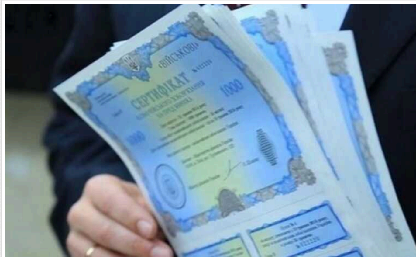
Мінфін у січні залучив майже 33 мільярди гривень від продажу ОВДП

За даними депозитарію НБУ, у січні 2024 року уряд залучив від розміщення ОВДП на аукціонах 13 млрд 361,3 млн грн, $254,7 млн та 235,5 млн євро. На погашення за внутрішніми борговими державними цінними паперами за цей період спрямовано $80 млн та 251,5 млн євро.