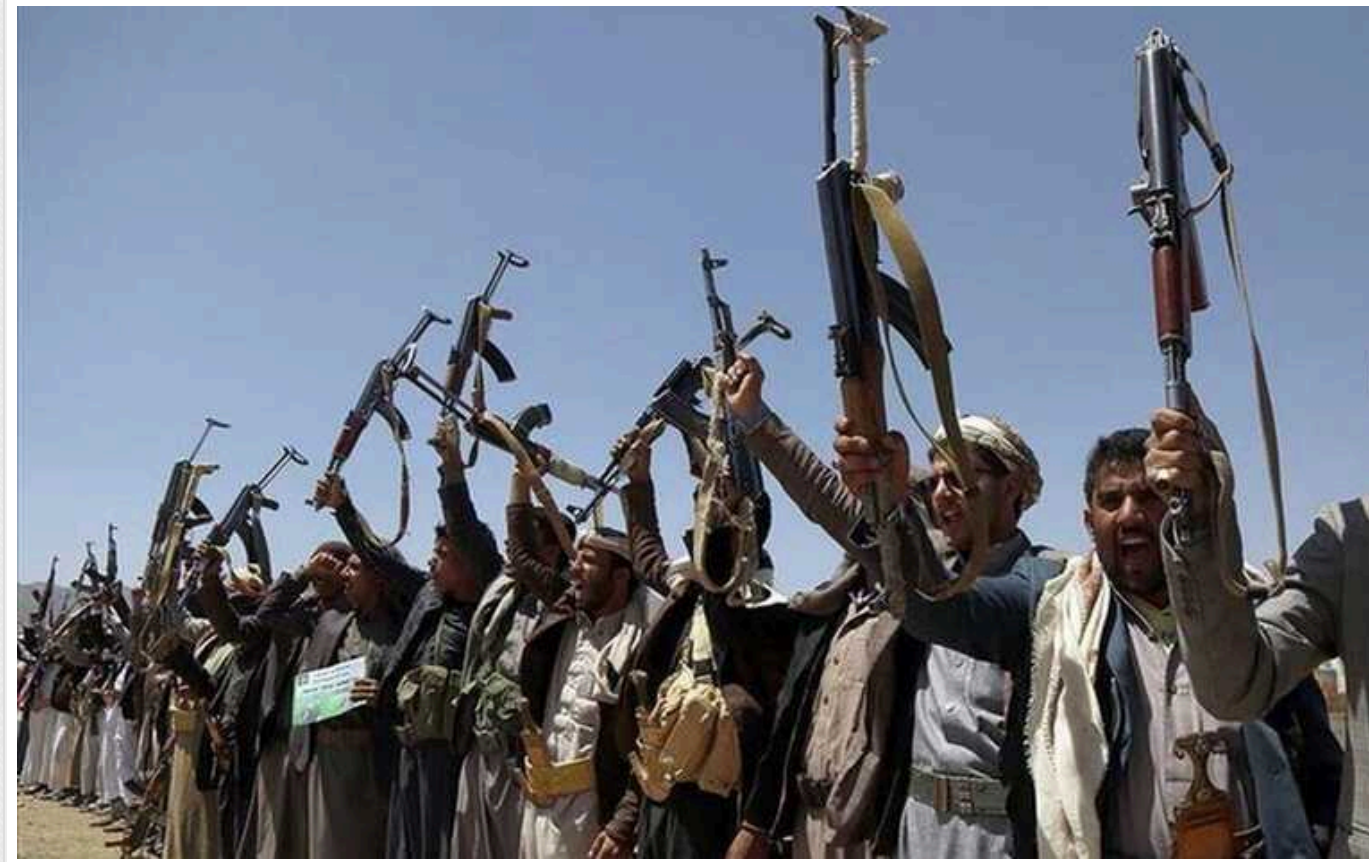
Хусити погрожують знищити стратегічні інтернет-кабелі в Червоному морі

Єменські хусити погрожують обрубати оптоволоконний кабель, який тягнеться дном Червоного моря, якщо США та Велика Британія ще раз ударять по аеропортах Ємену