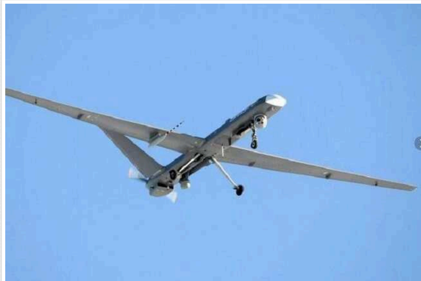
Доступна для ударів ЗСУ територія Росії перевищила мільйон квадратних кілометрів

Понад мільйон квадратних кілометрів території Росії (без урахування окупованих Криму та Севастополя) знаходиться в зоні, яка слабка для безпілотників української армії. Про це пишуть РосЗМІ.