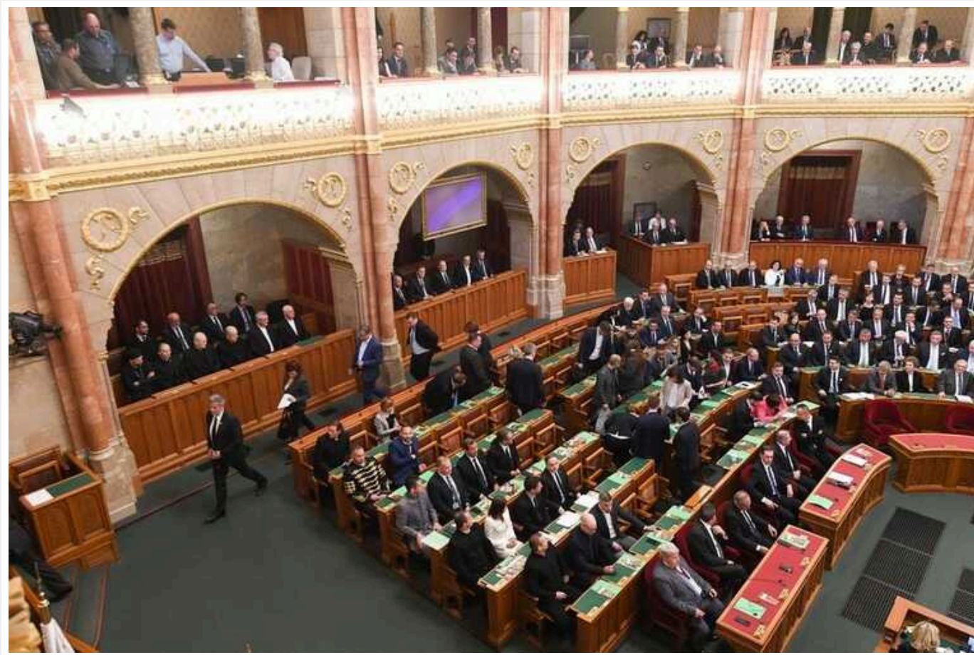
Угорщина висуває нові умови для вступу Швеції до НАТО

Угорщина поставила умову, що прем'єр-міністр Швеції має відвідати Угорщину, перш ніж вона ратифікує вступ Швеції до НАТО.