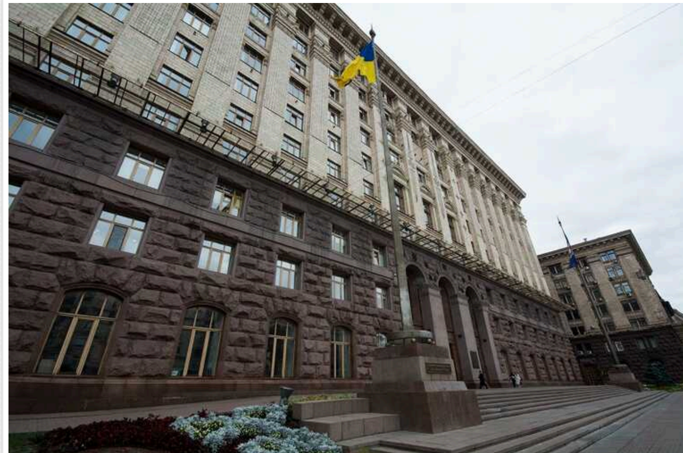
У Київській хотіли віддати депутату від забороненої ОПЗЖ керівну посаду в комісії з питань культури