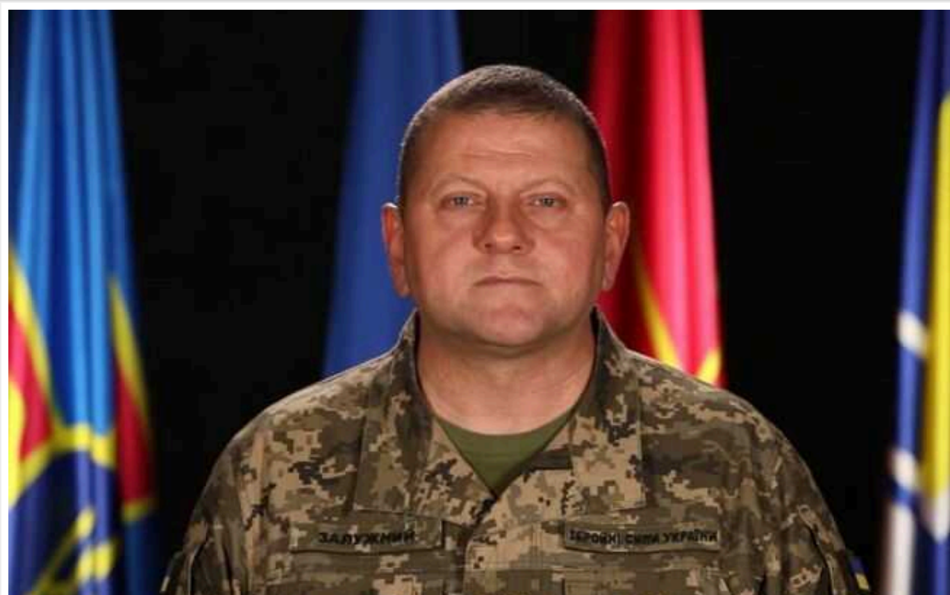
NBC News: Чутки про відставку Залужного оголили розкол у керівництві України

На Заході висловлюють думку, що хоча головнокомандувач ЗСУ Валерій Залужний залишається на своїй посаді, "спекуляції про явний розрив між ним і президентом Володимиром Зеленським – що здебільшого ґрунтуються на анонімних оповіданнях – оголили можливі тріщини у керівництві країни".