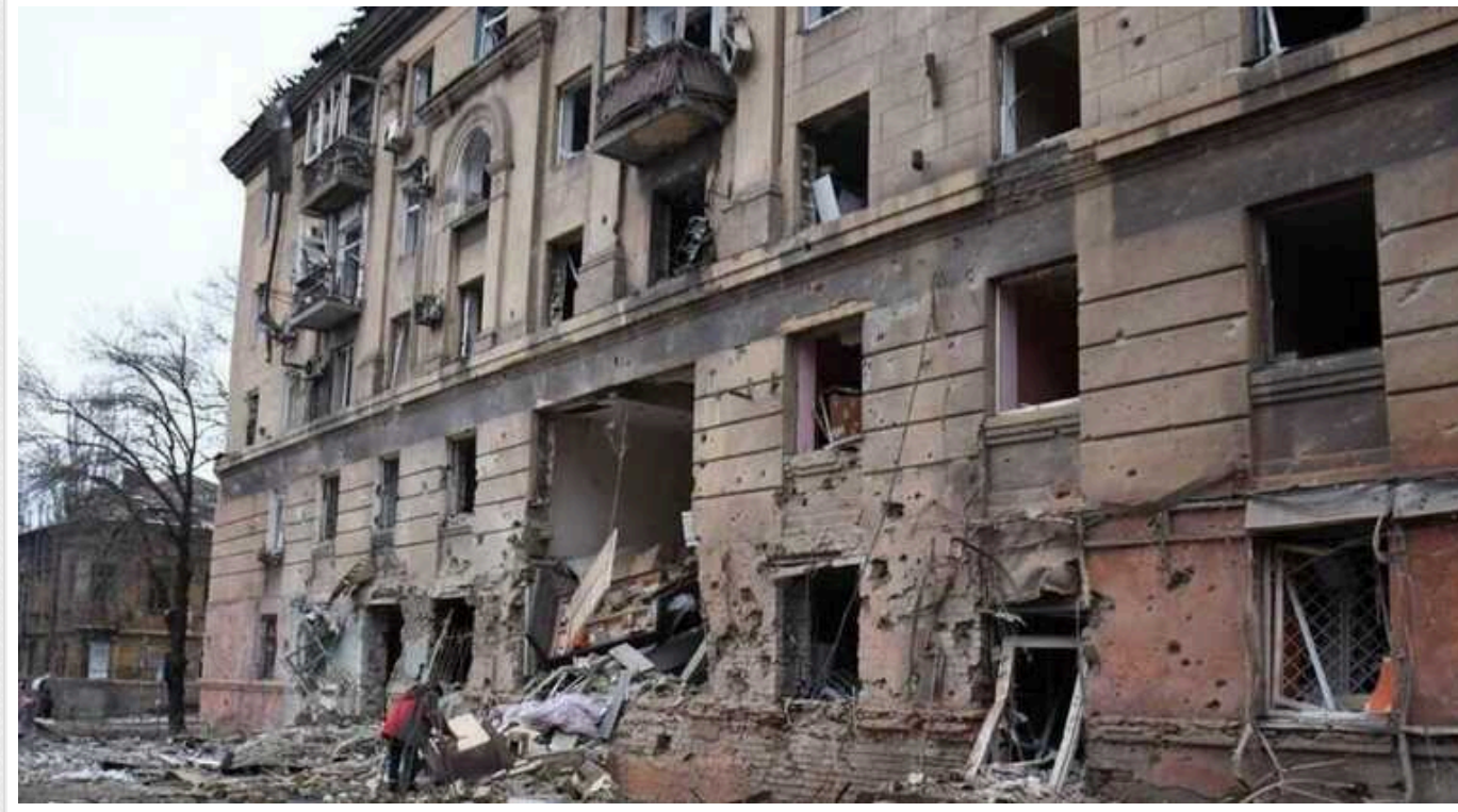
Німецький канал зняв репортаж із окупованого Маріуполя: МЗС України вимагає пояснень

Репортер німецького телеканалу ZDF відвідав тимчасово окупованій Маріуполь, звідки зняв репортаж. Міністерство закордонних справ України закликає канал пояснити поїздку без погодження з Україною.